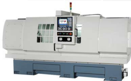
CNC Lathe (Flat Bed Type)

Компания Handy-Age Industrial Co. была основана в 1981 году и в настоящее время предлагает широкую номенклатуру высококачественных инновационных изделий – таких, как металлообрабатывающие станки, станочные приспособления и ручные инструменты.