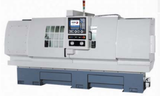
CNC Lathe (Flat Bed Type)

خط انتاج الالات القطع المعدنية في الشركة يشتمل على طاحونة مقاعد والالات نقش وطحن مضبوطة على الحاسوب ومحاولا الالات والالات الشطب والالات الحفر ومناشير افقية ومخارط. عروض مستلزمات الالات تشمل قطع تثبيت ومثاقب ومحاور العجلة ورؤوس تقسيم وطالات دوارة مثاقب حفر وملازم الالات واشياء اخرى كثيرة. يوجد في الشركة فيق مؤهل في البحث والتطوير مستعد وقادر على تقديم خدمات متكاملة للعملاء بما فيها التجهيزات الاصلية وعمليات تصنيع تصاميم. الفضل يعود الى اقامة شبكة مبيعات واسعة الانتشار تغطي تايوان والصين والشركة قادرة على مساعدة العملاء على الحصول على المنتجات التي يحتاجون اليها. تفخر الشركة ليس فقط بقدرتها الى تزويد العملاء في جميع النحاء العالم بالمعلومات الحديث والسوقية والصناعية ولكن ايضا بالخبرات القوية والتي بموجبها تقدم خدماتها الى المشتريين.