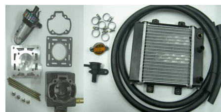
Dio Wasser-Kühler 54mm Zylinder Kit (94.8cc)