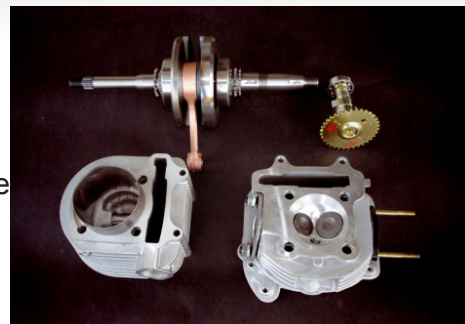
GY6 Oversize-Zylinder-Kit 2V (232.69cc)

Der mühevolle Weg zum Weltklasse-Lieferanten hat sich aber gelohnt, denn das Unternehmen ist nun in der Lage diverse Motoren und Performance-Teile für Motorräder, darunter Performance-Fittings, Ölkühlsysteme (mit Ölabflussteilen), Verbindungselemente, Zylinderköpfe, Zylinderdichtungen und Öltemperaturanzeiger herzustellen. Dies legte den Grundstein für Aktivitäten auf Märkten in Europa, in den USA und Japan und in den letzten Jahren wuchsen die Exporte kontinuierlich zwischen 20 und 30 %. Zusätzlich zur Herstellung der Eigenmarke nimmt das Unternehmen auch Aufträge aus Basis von OEM und ODM an.