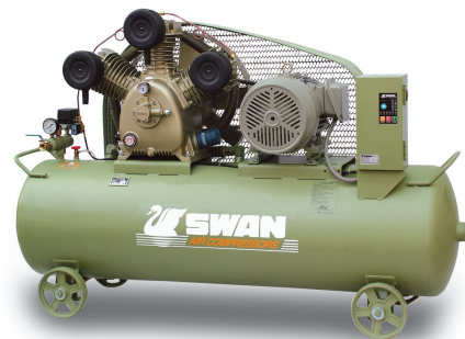
SWU-310N, 10HP, 55 CFM