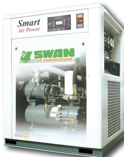
TS-37-S, 50HP, 208CFM

东正公司积极推动全面质量管理，早已养成「人人都是品管员」的默契，从原料的进厂检验、制程检验到最终成品的质量检验等，利用精密的分析仪器设备，使产品质量能完全控制在一定标准，确保产品处于最佳运转状态，为客户创造最大效益。