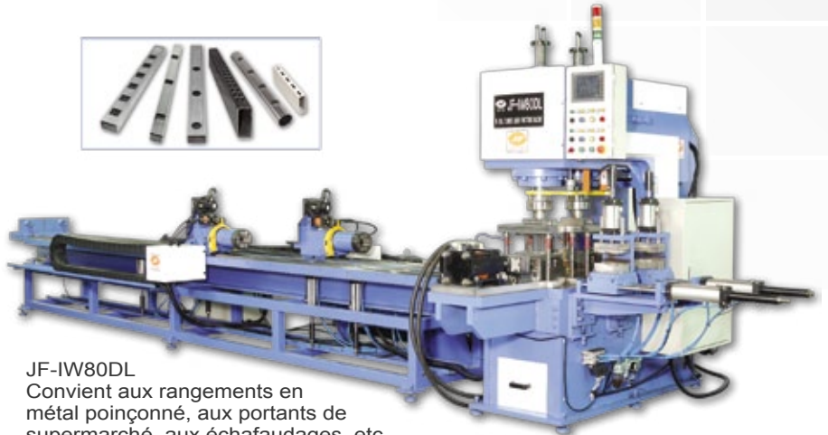
JF-IW80DL Convient aux rangements en métal poinçonné, aux portants de supermarché, aux échafaudages, etc.