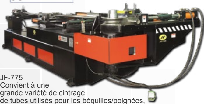
JF-775 Convient à une grande variété de cintrage de tubes utilisés pour les béquilles/poignées, les cadrans de portes et de fenêtres, et les pare-chocs de voitures.