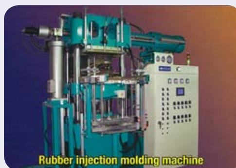
Rubber injection molding machine