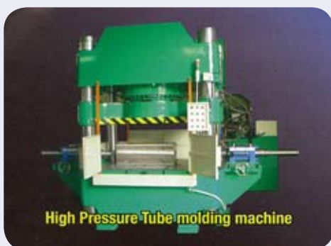
High Pressure Tube molding machine

Die Produkte von Hisun werden in Taiwan verkauft sowie auch nach Hongkong, China, Japan, Malaysia, Thailand, Indonesien und Vietnam exportiert. Das Unternehmen hofft, seine globalen Geschäftstätigkeiten durch sein hervorragendes Angebot von Produkten und Service ausbauen zu können.