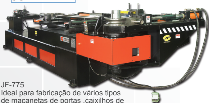
JF-775 Ideal para fabricação de vários tipos de maçanetas de portas, caixilhos de janelas, e para-choques automotivos.