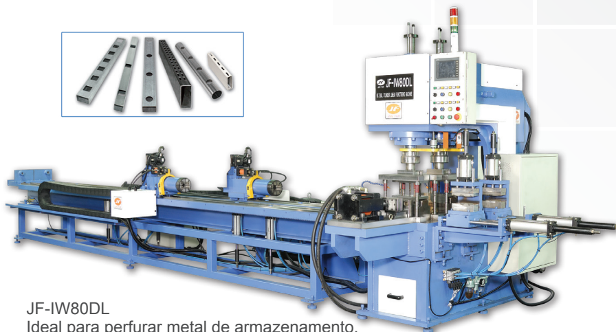
JF-IW80DL Ideal para perfurar metal de armazenamento, prateleiras de supermercados, andaime etc.