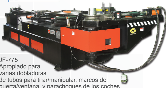
JF-775 Apropiado para varias dobladoras de tubos para tirar/manipular, marcos de puerta/ventana, y para choques de los coches.