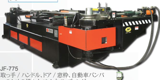
JF-775 取っ手 / ハンドル、ドア / 窓枠、自動車バンパーのための様々なパイプベンディング